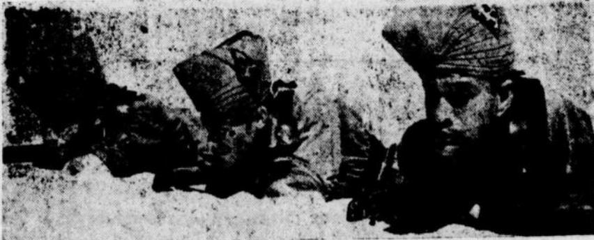
Tentera Radja Abiullah difront Palestina.

Menurut kawat malam Senin keadaan di Palestina hampir se bagai berikut :